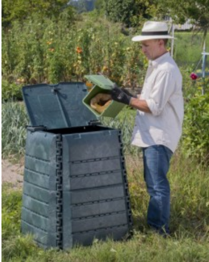
Composteur de 400 litres