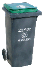
bac pour les emballages en verre de 120 litres

Le verre est collecté à domicile sur 5 communes du territoire (St-Loubès, Pompignac, Tresses, Carignan-de-bordeaux et Capian). Ces communes ont accepté un surcoût de collecte pour bénéficier de ce service.