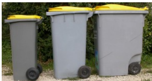
Bacs jaunes 120L, 240L et 360L

Les volumes des bacs à couvercle jaune (bac de tri) varient en fonction de la taille des foyers et sont adaptés pour permettre le stockage des recyclables sur 15 jours.