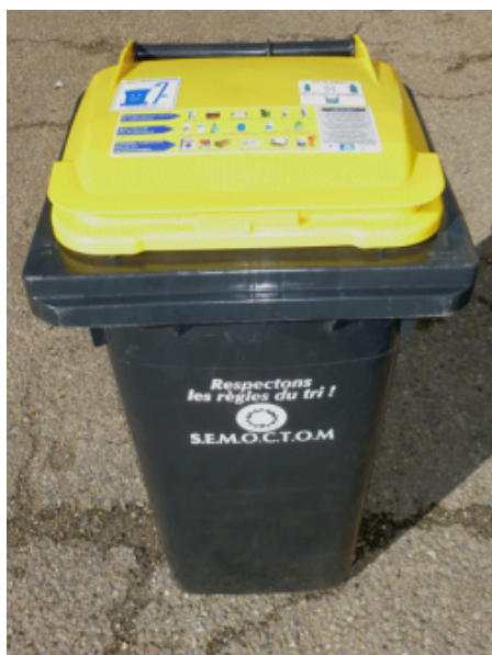
bac de tri à couvercle jaune