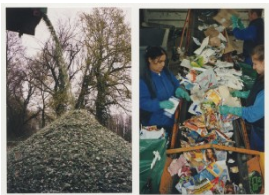
Recyclage du verre (calcin) et chaîne de tri

Après le tri et la collecte, les matériaux recyclables sont revendus aux différentes filières. Ces ventes viennent alimenter les recettes de la collectivité et permettent l'allègement des coûts de fonctionnement du S.E.M.O.C.T.O.M