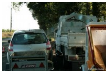
récupération du broyat de branche

En 2019, le service de broyage des branches change.